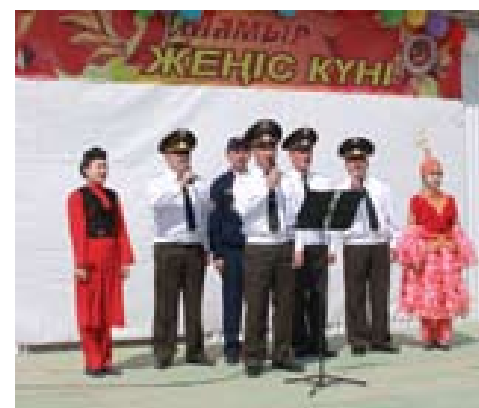
почтили минутой молчания.

Память погибших в Великой Отечественной войне и не доживших до этого светлого дня